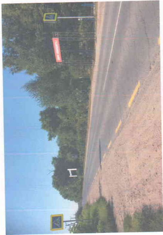
фото на странице: 3